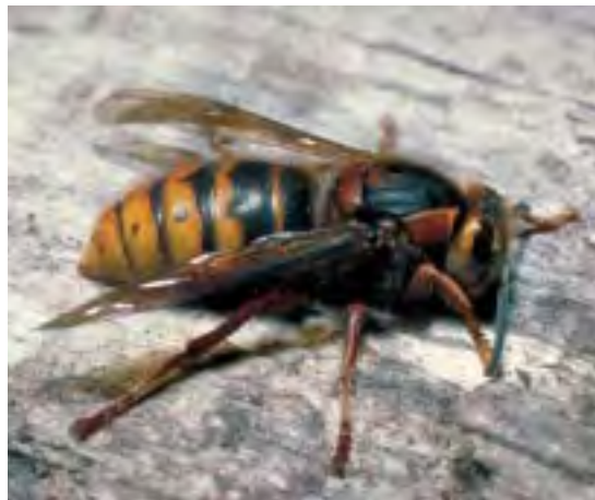
▶ Figuur 65 Een koningin van de middelste wesp Dolichovespula media .

De soort is in de jaren 1950 tot 1980 veel minder waargenomen dan in de periode daarvoor. Er zijn vrij veel recente meldingen.